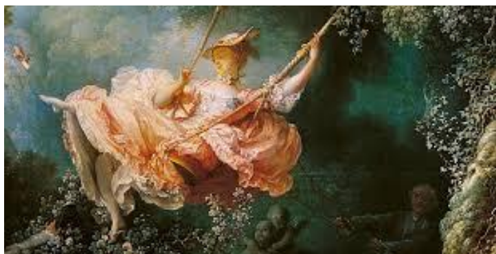
FRAGONARD, Jean-Honoré. L'Escarpolette, 1766, óleo sobre tela, 81cm x 64,2cm.

Observe as imagens abaixo, que foram publicadas no período estudado, e depois responda as questões.